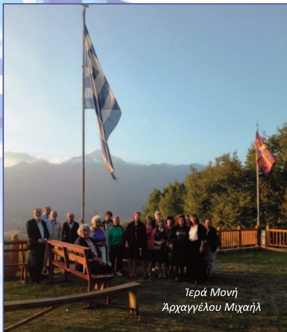
Ἱερά Μονή Ἀρχαγγέλου Μιχαήλ