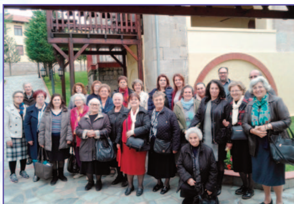
Ἱ.Μ. Ἀγίου Ἀθανασίου Σφηνίτσας