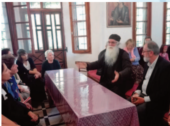
1. Μονή Ἁγ. Ραφαήλ, Νικολάου καί Εἰρήνης

της Βησσαρίωνας, μᾶς μίλησε γιά τούς νεοφανεῖς Ἁγίους καί τό ιστορικό τοῦ μοναστηριοῦ.