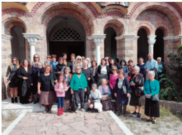
1. Μονή Ὁσίου Νικοδήμου Ἁγιορείτου

Ὁ ἐπόμενός μας σταθμός ἡ 1. Μονή τοῦ Ἁγ. Ραφαήλ, Νικολάου καί Εἰρήνης πού βρίσκεται πάνω ἀπό τό χωριό Γρίβα καί σέ ἀπόσταση 7 χιλ. ἀπό τή Γουμένισσα. Ἔχει θέα τήν κοιλάδα τοῦ Ἄξιου. Ὁ ἡγούμενος τῆς Μονῆς, Ἀρχιμανδρι-