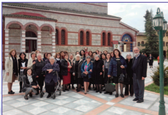
Ἱ. Μονή Ἁγίας Κυριακῆς

κωμόπολη, χτισμένη στους πρόποδες τοῦ βουνοῦ. Τό μοναστήρι τοῦ Ἀρχαγγέλου Μιχαήλ εἶναι ὁ τελευταῖος σταθμός τοῦ Ν. Πέλλας πρὸς τό Ν. Κιλκίς. Δεσπόζει πανοραμικά τοῦ κάμπου τῆς Ἀλμωπίας, ἀποτελεῖ φάρο πνευματικό τῶν ἐλάχιστων κατοίκων τῆς περιοχῆς. Φύγαμε ἐπιστρέφοντας στήν πόλη μας γεμάτοι λογισμούς εὐγνωμοσύνης.