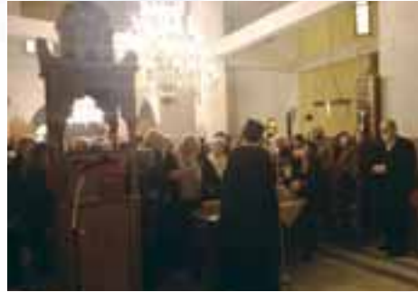
Στὴν Ι.Μ. Ἁγίου Παντελεήμονος καὶ Εἰσοδίων τῆς Θεοτόκου στὴν Ἁγιά τῆς Λάρισας.

Μετὰ ἀπὸ σύντομη στάση στὴν γραφικὴ Ραψάνη, ἐπόμενος προορισμός, ἡ Ἱερά Μονὴ Ἁγίου Παντελεή-