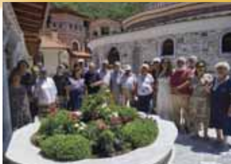
Στήν Ι. Μονή Ἀναλήψεως, στήν Πρώτη Σερρών.