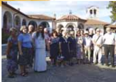
Στήν Ι. Μονή Ἀναλήψεως στούς Ταξιάρχες (Σίψα) Δράμας.

τήν ἀγιογράφηση τοῦ ναοῦ ἐπικεντρώνοντας τὴν προσοχή μας στὶς ἀξιόθιμαστές λεπτομέρειες τῆς μεταβυζαντινῆς τέχνης. Στὸ τέλος μᾶς δόθηκε ἀπὸ τὸν Γέροντα ἡ μεγάλη εὐλογία νὰ προσκυνήσουμε ἱερά λείψανα τοῦ Ἁγίου Παντελεήμονα, τῆς Ὁσίας Σοφίας τῆς Κλεισούρας, τῶν Ὁσίων Γεωργίου Καρσλίδη, Ἰερώνυμου Σιμωνοπετρίτη, Δανιὴλ Κατουνακιώτη καὶ Ἐφραὶμ Κατουνακιώτη. Ἀκολούθησε τὸ παραδοσιακὸ μοναστηριακὸ κέρασμα στὴ δροσερὴ αὐλὴ τοῦ μοναστηριοῦ.